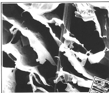
Vergrößerung im Raster-Elektronenmikroskop Enlargement as seen through an electron microscope Agrandissement au microscope électronique